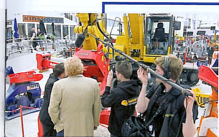
MEHR LIVE , mehr Infos, mehr Aufmerksamkeit: Bauforum24 TV filmt und sendet direkt vom Messegelände.

MESSE-LIVE-TV Das lebendige Messegesehen von recycling aktiv und TiefbauLive wird auch im Web-TV zu sehen sein. Als offizieller Medienpartner berichtet Bauforum24 TV jeden Tag über Neuheiten, Meinungen und Produkte. Im Messestudio werden die Sendungen direkt vor Ort produziert. Alle Sendungen sind rund um die Uhr im Internet zu sehen. Für Smartphone-Nutzer stehen sie auch unterwegs als Podcast für iPhone, Blackberry und Co. zur Verfügung. www.bauforum24.tv